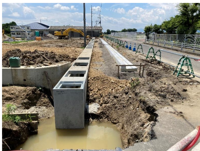
【↑歩道の縁石も少しずつ出来てきています。】